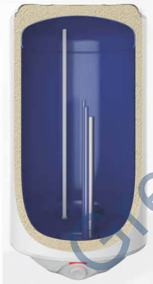
STYLE DRY FD - сухий тен

Тип водонагрівача: накопичувальний Установка: настінний, вертикальний Ємність: 30, 50, 80, 100 літрів Бак для води: емальований Тен: сухий трубчастий/мокрый мідний