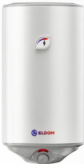
STYLE F - мокрий тен