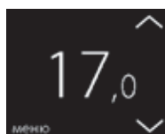
Екран у режимі керування